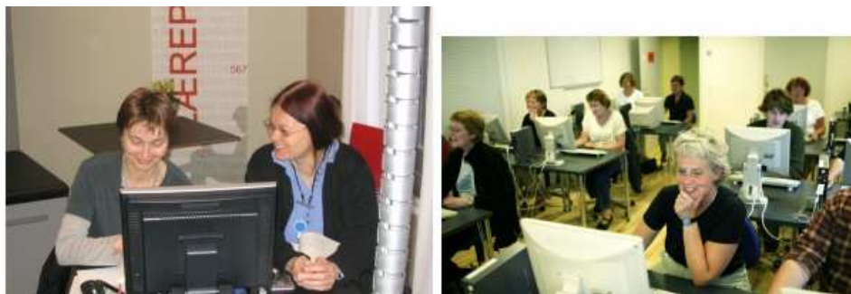
Existen muchos métodos disponibles para la formación del personal: desde las mentorías hasta las clases en un aula

Existen un serie de cursos que son importantes para el personal: debería formarse como profesor/formador/guía en relación con los usuarios, y debería aprender a desarrollar materiales didácticos. El personal debería adquirir técnicas educativas, informarse sobre los métodos pedagógicos, las teorías de la comunicación, el uso de TIC, y las técnicas de entrevista y presentación. Es importante planificar la educación sistemática del personal en enseñanza.