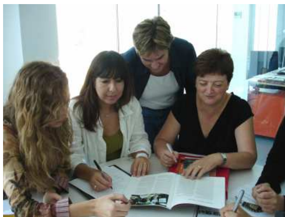
Aprendizaje en pequeños grupos informales (miembros del personal de Barcelona)