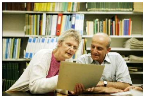
El aprendizaje puede adoptar muchas patrones y formas: el aprendizaje no formal o informal es tan válido como el aprendizaje formal

En el Reino Unido, el MLA (Museums, Libraries and Archives Council) –el organismo que se encarga de proporcionar dirección y apoyo estratégicos al sector de las bibliotecas, los museos y los archivos– ha adoptado la definición de la Campaign for Learning en su iniciativa Inspiring Learning for All , que cuenta con una caja de herramientas para evaluar el apoyo que estas instituciones prestan al aprendizaje. ( http://www.inspiringlearningforall.gov.uk/default.aspx?flash=true )