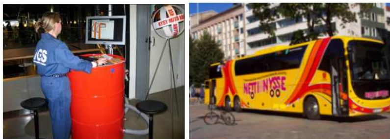
La flexibilidad en el entorno físico es importante. Arriba: Information Gas Station (Gasolinera de la Información) y autobús con internet en Finlandia