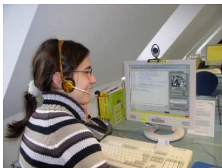
El proyecto PuLLS se ha ocupado de diversas tecnologías, por ejemplo, videoconferencias (Würzburg)

CILIP, una asociación profesional del Reino Unido, ofrece una definición sencilla: " Competencia informacional es saber cuándo y para qué necesitan información, dónde encontrarla, y cómo evaluarla, utilizarla y comunicarla de una forma ética". (CILIP, 2004)