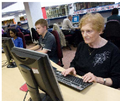
La Comisión Europea se ocupa de los retos que plantea para el aprendizaje permanente el envejecimiento de la población en Europa

Se insiste sobre todo en los aspectos que tienen que ver con las habilidades y la formación relacionadas con el aprendizaje, porque la Comisión considera que el papel del aprendizaje permanente constituye un ámbito decisivo en la respuesta a toda una serie de retos [económicos]: "el alcance de los cambios económicos y sociales actuales, la rápida transición a una sociedad fundamentada en el conocimiento, y la presión demográfica resultante del envejecimiento de la población en Europa son todos retos que exigen un nuevo enfoque de la educación y la formación, dentro del marco del aprendizaje permanente" (Comisión Europea, 2000).