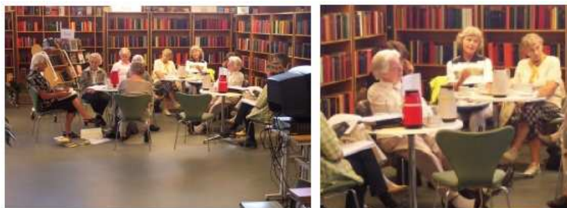
Aprendizaje permanente en las bibliotecas públicas significa muchas cosas. Arriba: una reunión del "Café literario"

Los módulos se desarrollan y actualizan constantemente. Según la materia, el programa de formación sistemático varía y puede estar formado por pocos módulos o por una gran variedad de ellos. Los participantes pueden ser integrantes de diversas instituciones, por ejemplo archivos, bibliotecas y museos, según la materia.