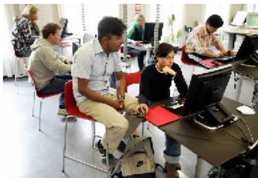
¿Qué es aprendizaje? Las directrices ofrecen una definición del aprendizaje permanente

Las directrices describen las "mejores prácticas" y ofrecen sugerencias sobre: