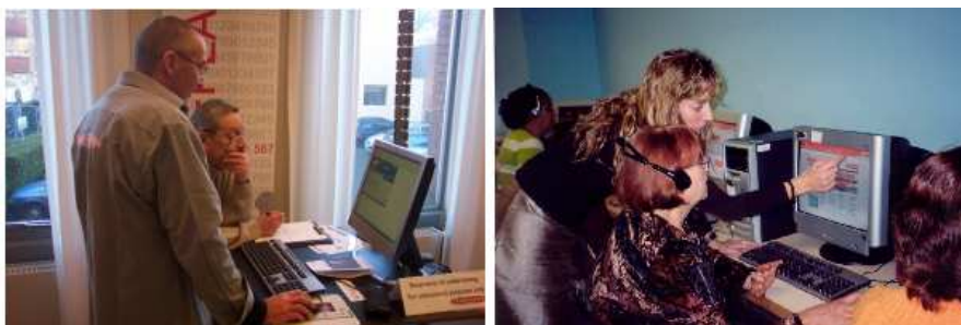
La formación de los usuarios puede ir desde la formación de unas cuantas personas hasta clases en un aula

Formación de una clase: se puede enseñar a un grupo más grande, de unas 15 personas, por ejemplo a utilizar internet o a hacer búsquedas en la base de datos de la biblioteca, con demostraciones en un monitor grande y ejercicios prácticos.