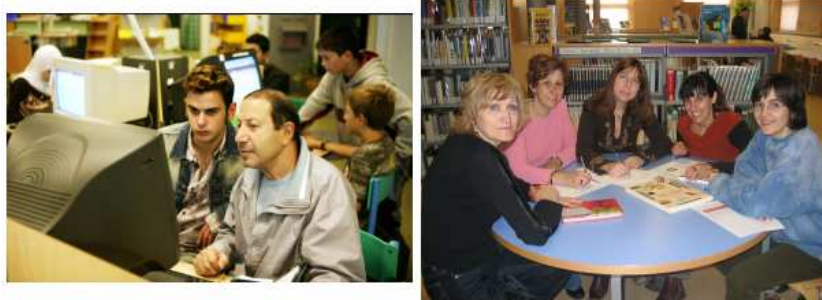
Ejemplos de entornos de aprendizaje en bibliotecas públicas

El material de marketing debería incluir el logotipo de la institución; las imágenes también son importantes.