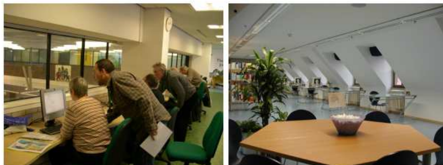
Ejemplos de espacios de aprendizaje flexibles y acogedores de Sutton (Inglaterra) y Würzburg (Alemania)