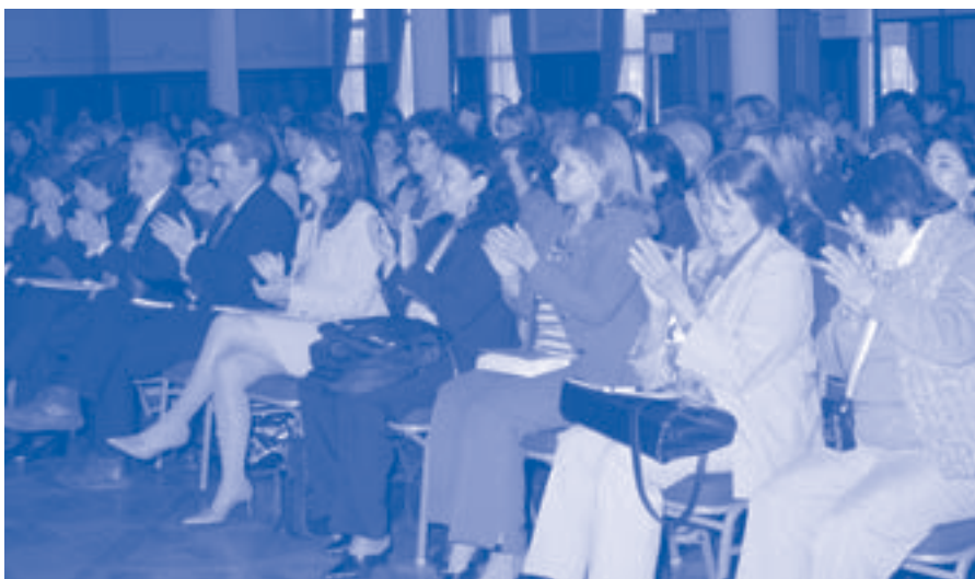
Red 12. Participantes al Tercer Seminario Anual.

El trabajo activo y participativo de los soci@s así como el intercambio de experiencias y de diferentes realidades fue muy interesante y fructífero. Como resultado del debate y la interacción se elaboraron 13 propuestas de proyecto común (disponibles en la página Web de la red http://www.diba.es/urbal12/ ) para presentar en próximas convocatorias de proyectos. ■