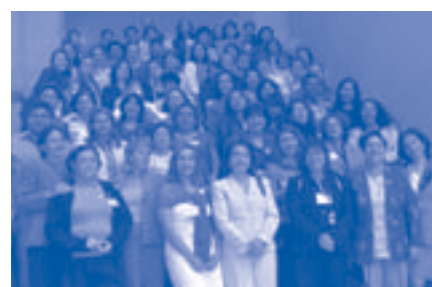
Quito. Participantes a la conferencia en el marco del proyecto.

Muchas han sido las enseñanzas que se desprenden de la experiencia de cada ciudad socia y de otras europeas y latinoamericanas,